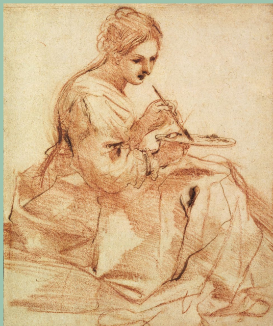
Il Guercino, Una donna che dipinge

SERVIZIO SANITARIO REGIONALE EMILIA-ROMAGNA Azienda Unità Sanitaria Locale di Ferrara